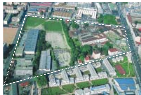
vue aérienne du Bon Lait

Ce projet d'envergure vise à créer un nouveau centre de quartier pour le secteur nord de Gerland. Le Bon Lait proposera un environnement particulièrement agréable afin de promouvoir une forme et des conditions d'habitat très attractives. A terme, cette opération ambitieuse prévoit la construction d'environ 120 000 m 2 SHON pour des logements, des activités, du commerce et des bureaux.