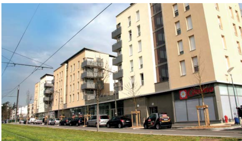
Programme de logements et commerces en rez-de-chaussée (LMH / HTVS) - Ilot A.