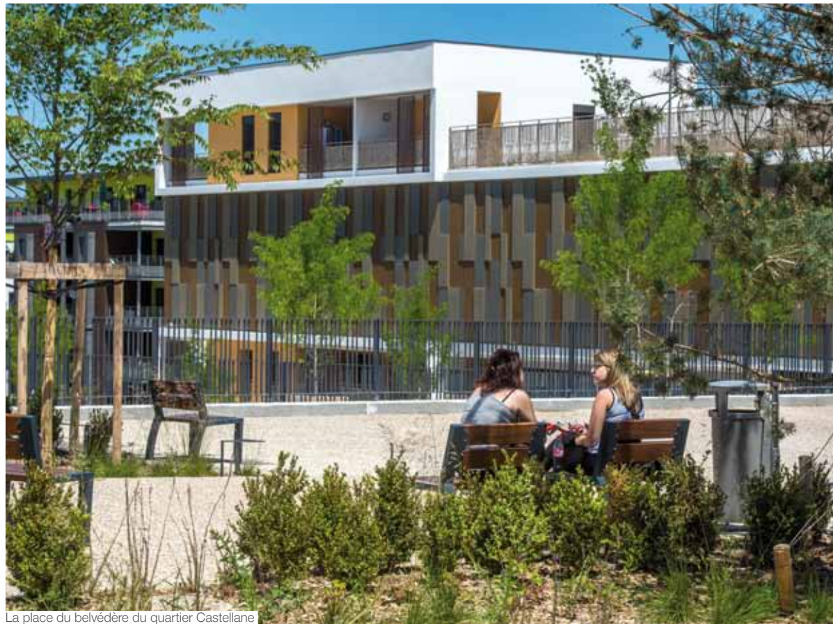
La place du belvédère du quartier Castellane