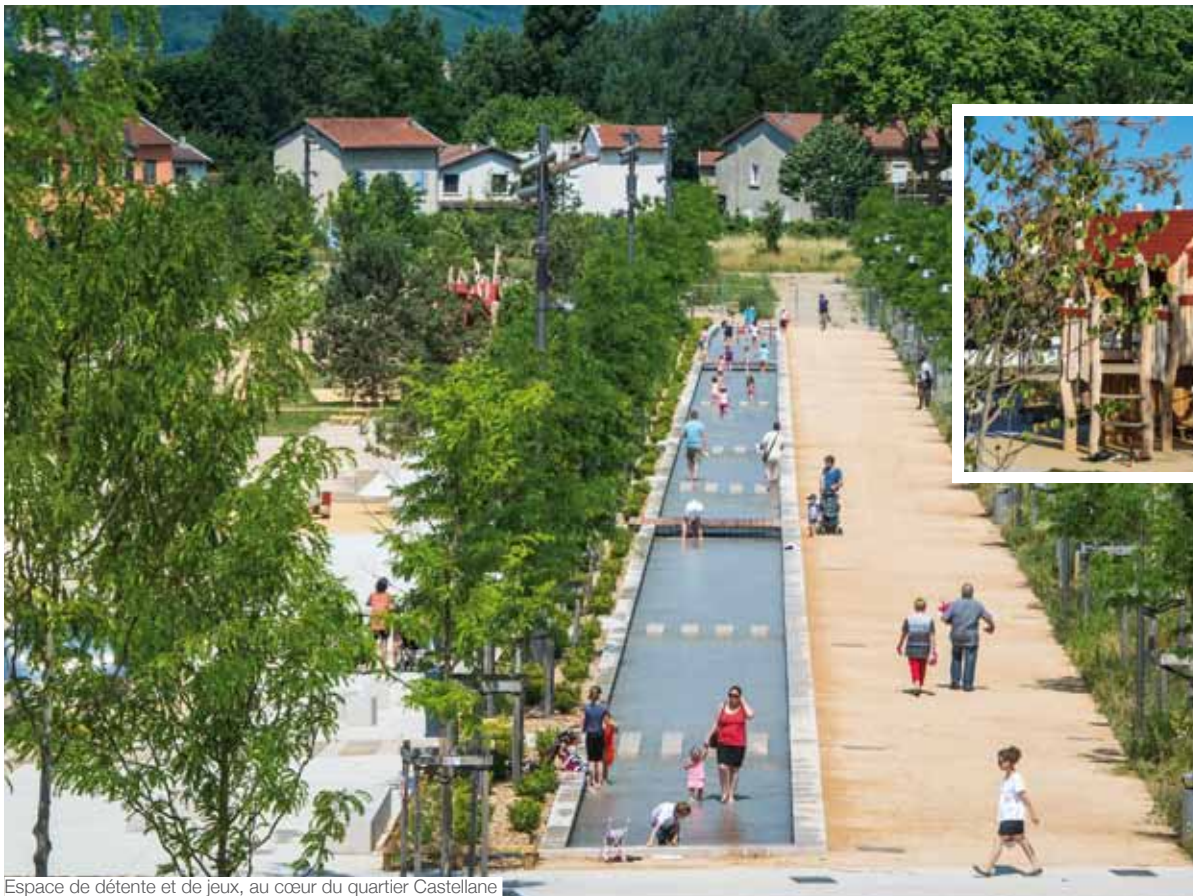
Espace de détente et de jeux, au cœur du quartier Castellane