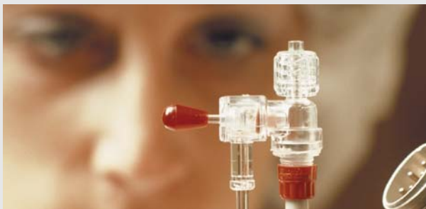
Lyon Métropole Innovante