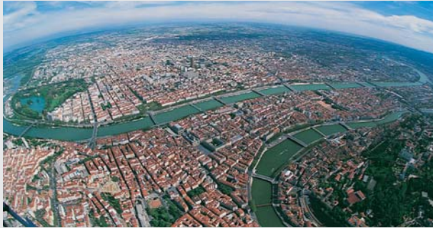
Lyon Porte d'Europe

Les EXCELLENCES ont pour vocation l'accueil de créateurs, de start-up, d'entreprises innovantes et de haute technologie :