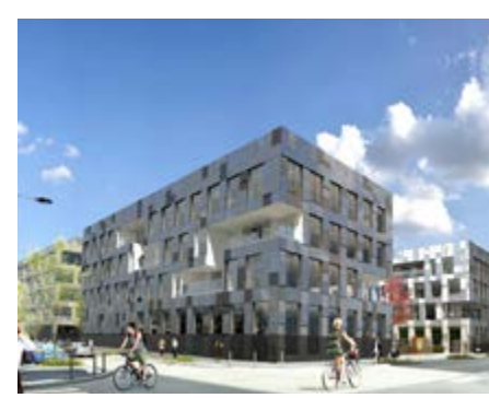
Bâtiment Namco Bandai