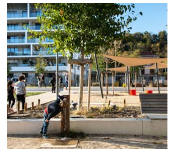
Jardin des trembles