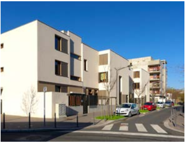
Docklands logements