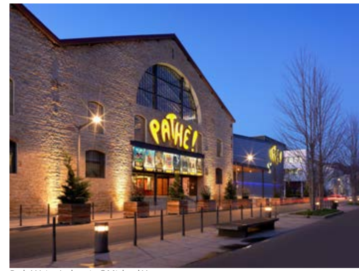
Pathé Vaise Industrie