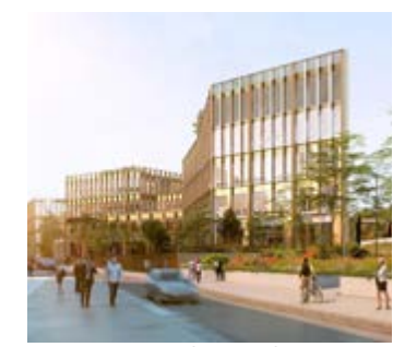
Bâtiment Nexity, depuis Felix Mangini