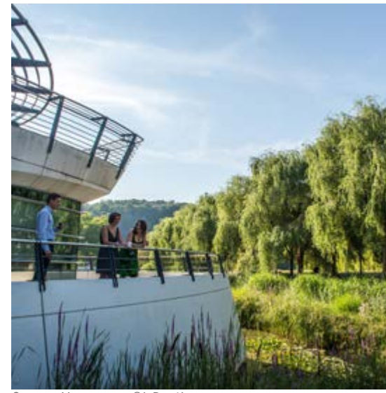
Campus Verrazzano