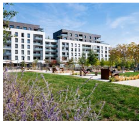
Jardin des trembles