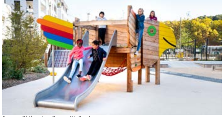
Square Philomène Rozan

Square PHILOMÈNE ROZAN Logements DIAGONALE et ALLIADE