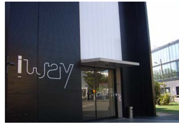
ZAC nord projet Iway