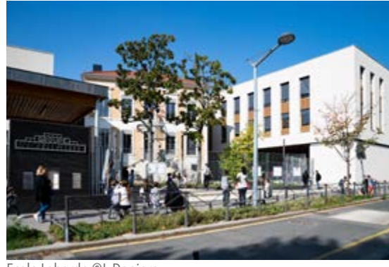
École Laborde