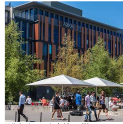
AKKA - Rue Antonin Laborde

Ouverture du PATHÉ VAISE Bâtiments APICIL et IWAY Logements DIAGONALE et OPAC