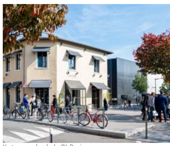
L'octave rue des docks

Square PHILOMÈNE ROZAN Logements DIAGONALE et ALLIADE