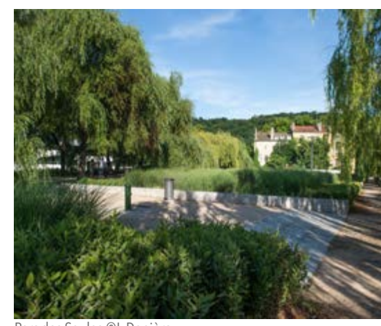
Parc des Saules

Livraison rues des MURIERS et Plasson & Chaise