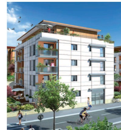
Bâtiment "P2" situé sur la rue Aimé Césaire

(modifications des décrochages en façade pour améliorer la thermique...) et pour rendre leurs façades homogènes avec celles de l'îlot 3.