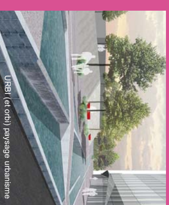
URBIL (et orbil) paysage urbanisme

Les travaux ont démarré au printemps 2010. Inauguration à prévoir en fin d'année !