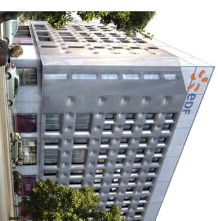
JP VIGUIER SA Architecture

Profitant de l'image moderne et respectable de la ZAC, EDF a lancé la réhabilitation de son immeuble situé à l'angle de l'avenue Thiers et de la rue des Emeraudes. Le bâtiment EDF, vise le label « basse consommation » une première sur de la réhabilitation de bâtiment.