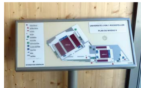
Borne interactive sensitive Site universitaire Rockefeller à Lyon 8 ème

A chaque étape de réalisation du projet (construction, gestion et utilisation), la SERL applique les principes de développement durable : recherche d'économies d'énergies, confort des bâtiments, techniques d'éco-construction, prise en compte des personnes à mobilité réduite et des différents handicaps (cognitifs, moteurs, visuels, auditifs...).